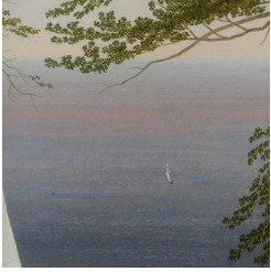
© Kunst Museum Winterthur Reinhart am Stadtgarten Foto Anja Dollinger